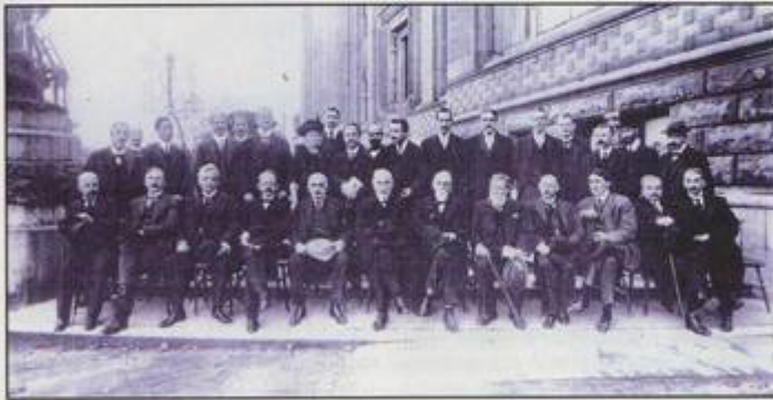
Die Teilnehmer der Solvay-Konferenz 1913. Einstein durfte nur noch zuhören, aber keinen eigenen Vortrag mehr halten. Poincaré, der jegliche Kollaboration ablehnte, fehlt bereits: Er war bald nach der Konferenz von 1911 „überraschend verstorben“. Frd. Lindemann, der englische Student, steht halbrechts hinter Einstein.

„Millikan versuchte öfter, fremde Erfolge für sich in Anspruch zu nehmen. Eine Erklärung für solches Verhalten, die mir aber noch