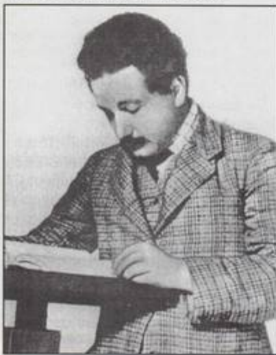
Von Heisenberg schelmisch als „der Pudel in Fausts Studierzimmer“ bezeichnet: Der im Jahre 1879 – als die Kopernikus-Fälschung ans Licht kam (Magazin 2000plus, Nr. 144, S. 70) – am „Pi-Day“ (3/14, also am 14. März) geborene Einstein. Aber dessen Lieblingslektüre war angeblich „Don Quichote, der Ritter von der traurigen Gestalt“ (2, S. 339).

Es ist anscheinend eine lustige Gesellschaft, die sich 1928 in der Berliner Wohnung des Nobelpreisträgers Max von Laue versammelte. „Fünf auf einen Streich!“ mag sich der Fotograf über die Handvoll Nobelpreisträger gefreut haben (Abb. 1). Läßt er die Fotografie längere Zeit auf sich wirken, beschleicht den unbefangenen Beobachter allerdings ein gewisses Unbehagen: Ist das wirklich nicht mehr als die harmlose