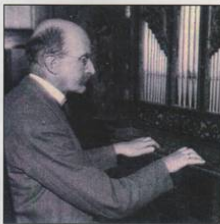
Plancks Leidenschaft waren das Bühnenspiel und die Kirchenmusik. Sein Leben in dem allernächsten Umfeld des preußisch-protestantischen Königshofs und dessen Machtstrukturen war durchwirkt von mythologisch-religiösen Motiven. Wer dies begreift, versteht die Ursprünge der modernen Physik und die Tragödie der Wissenschaft des 20. Jahrhunderts.

Die später aufgekommenen Gerüchte über brisante Enthüllungen in einem schließlich verschollenen Testament Max von Laues sowie sein mysteriöser Unfalltod zu Plancks Geburtstag seien nur erwähnt (11).