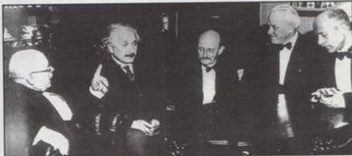
Ein Foto, das in kaum einer Einstein-Biographie fehlt – oft aber falsch datiert, bisweilen sogar retuschiert, jedoch noch nie interpretiert. Es gibt außer diesem offiziellen auch noch einen zweiten Schnappschuß, der wenige Sekunden später zustandekam und den Eindruck einer deutlich entkrampften Atmosphäre vermittelt. Das gestochen scharfe Aufnahmeoriginal im Reichsmuseum für die Geschichte der Naturwissenschaften in Leiden zeigt, daß das Gemälde im Hintergrund nur provisorisch – eigens für den Schnappschuß – angebracht ist.

„Der Werdegang vom Wissen um die Natur ist reich an Ereignissen, die tief in der romantischen Sphäre des Märchenhaften wurzeln und als halbvergessener Spuk durch die Jahrhunderte vegetierten ... Sehr häufig triumphierte