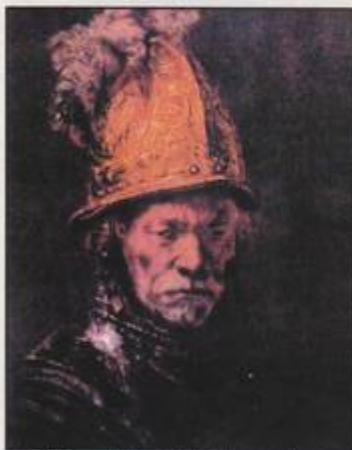
Der „Mann mit dem Goldhelm“ war stellvertretend für Ferdinand Ritter von Lindemann (Adelstitel seit 1918) in die Nobelpreisträgerrunde einbezogen. Das berühmte Gemälde erweist sich nun als Menetekel: Die neuere kunsthistorische Forschung meint, der „Mann mit dem Goldhelm“ stamme gar nicht – wie man bisher dachte – von Rembrandt...

Der Schriftsteller August Julius Langbehn (1851–1907) hatte mit